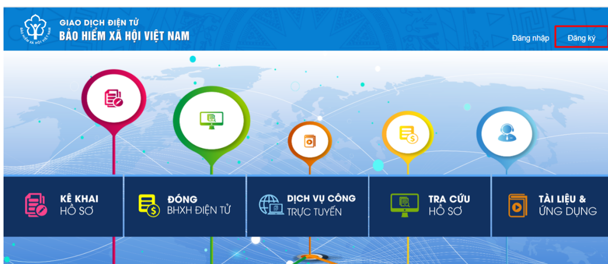
Hình 2.1. Màn hình trang chủ

Bước 2: Trên màn hình trang chủ, chọn “ Đăng ký ” để hiển thị màn hình đăng ký trên Cổng Dịch vụ công: